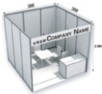
豪华展位配置示意图